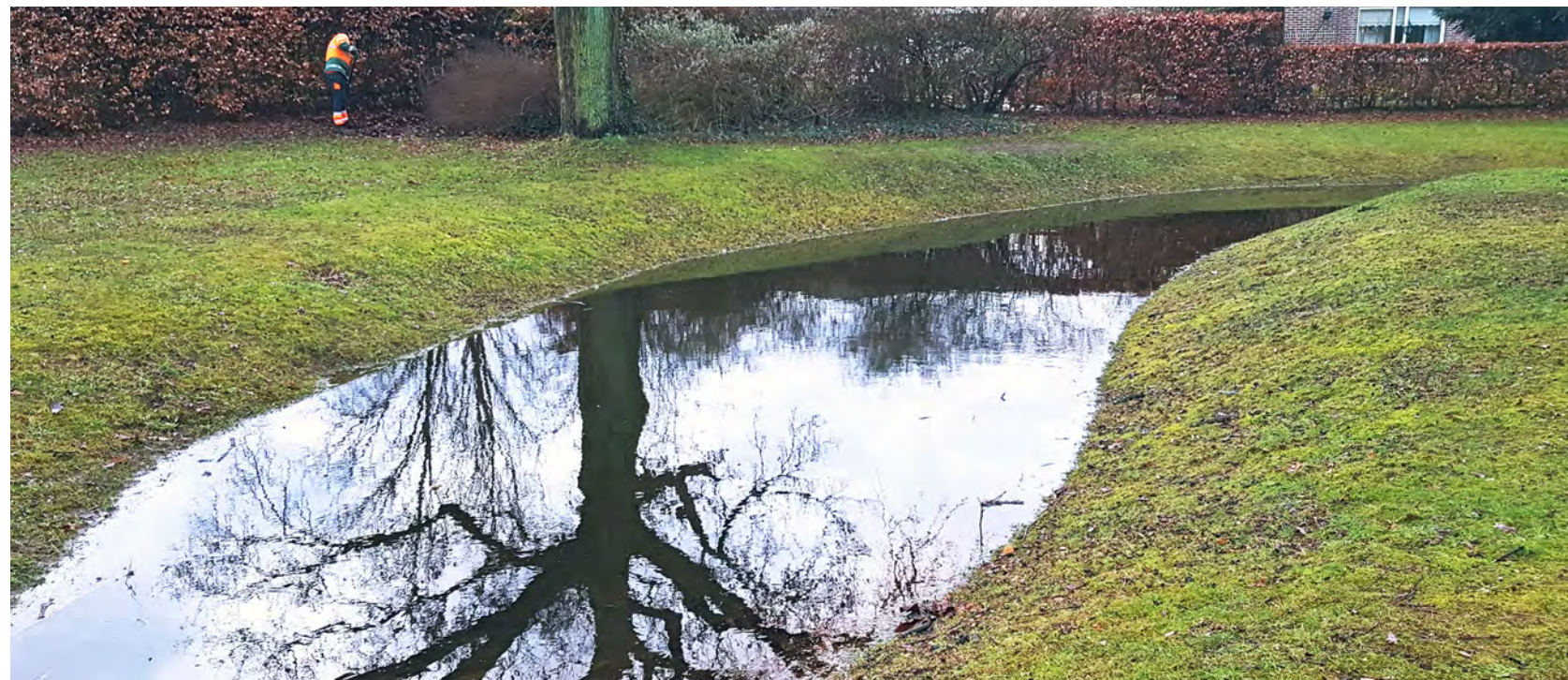
Wadi in de wijk Ruwenbos, Enschede.

bijeenkomst over biodiversiteit in Enschede. ‘Om leefbaar en aantrekkelijk te blijven, moet Enschede vergroenen’, zegt Stefan Volmer, beleidsadviseur Leefomgeving bij die gemeente. Enschede ligt op een stuwwal en is daarom extra kwetsbaar voor de effecten van klimaatverandering: delen van de stad staan snel onder water. Daarnaast zorgt verstening voor temperatuurproblemen – in augustus 2022 tikte de Enschedese thermometer 54 graden Celsius aan – en kampen sommige plekken met extreme verdroging; een erfenis uit het textielverleden.