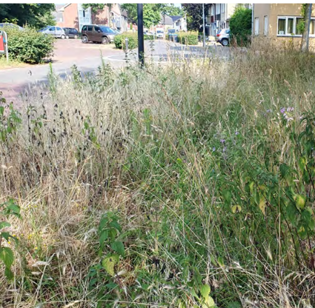
Bewust minder vaak gemaaide berm middenin de wijk. Oikos, Enschede